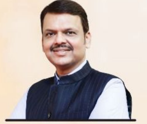
देवेंद्र फडणवीस मुख्यमंत्री