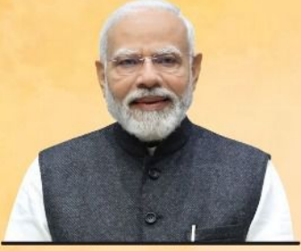
नरेंद्र मोदी प्रधानमंत्री